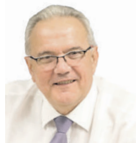
Neven Mimica, commissaire européen chargé de la Coopération internationale