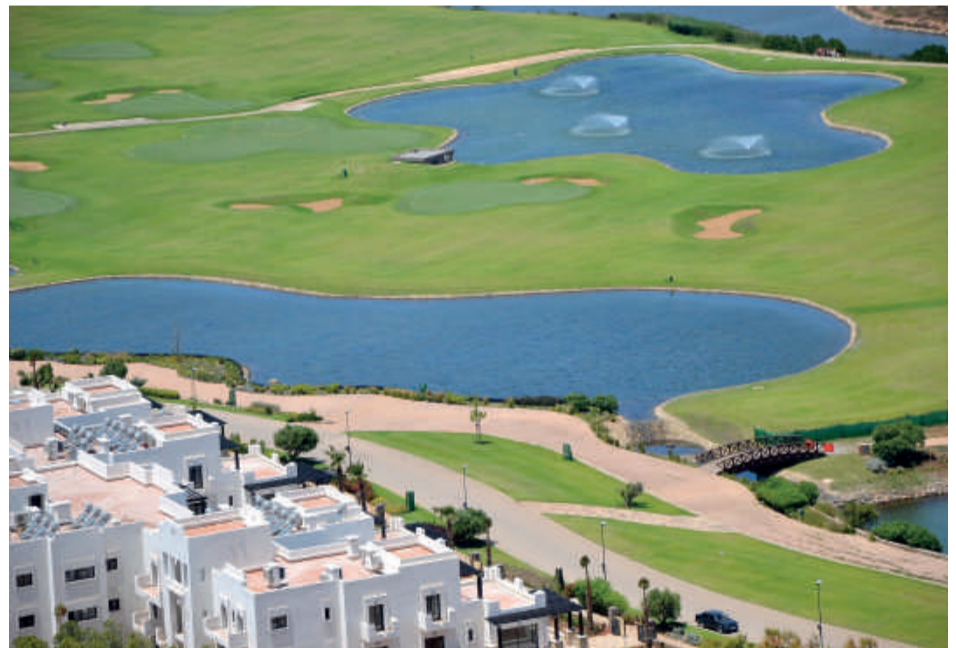
Lieu paradisiaque par excellence, la station Marchica assure une offre haut standing d'hébergement et d'hôtellerie