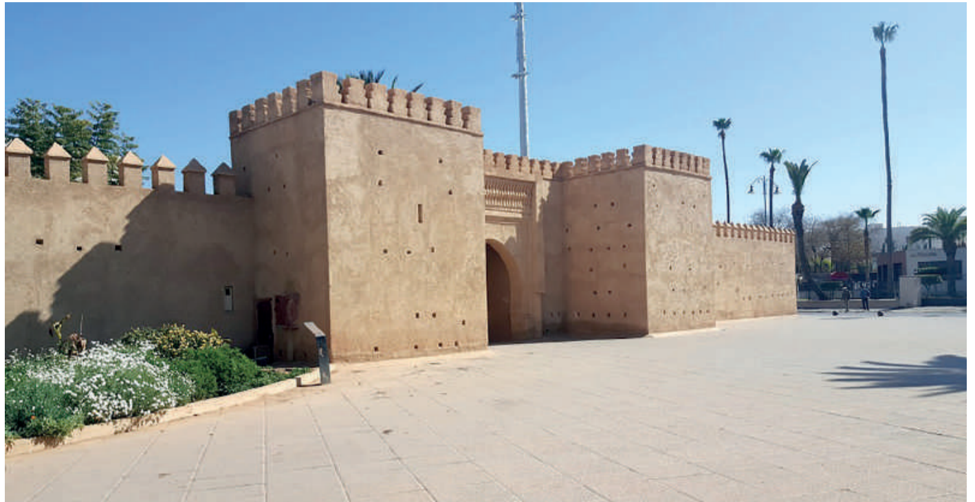
La muraille et les remparts de la médina d'Oujda furent renforcés à maintes reprises 1894, 1948, 1980 et 2017. Les retouches apportées n'ont en aucun cas dénaturé la splendeur originelle de l'édifice

POUR encourager les familles marocaines à passer leurs vacances dans l'Oriental, le Conseil régional du tourisme, la Délégation régionale du tourisme en collaboration avec les professionnels du secteur et les autorités locales ont peaufiné un programme attractif en mesure de sauver une saison estivale qui s'annonçait difficile. Des réunions marathoniennes ont abouti à la réduction des prix de 20% ou 30% avec des offres promotionnelles pour les réservations à temps et le nombre de nuitées. D'ailleurs le CRT a lancé un site https://visitoriental.ma/ pour la promotion de cette destination. L'Économiste vous propose un circuit à découvrir pour la diversité de ces paysages et la particularité de ces sites; également pour la qualité des infrastructures mises à disposition.