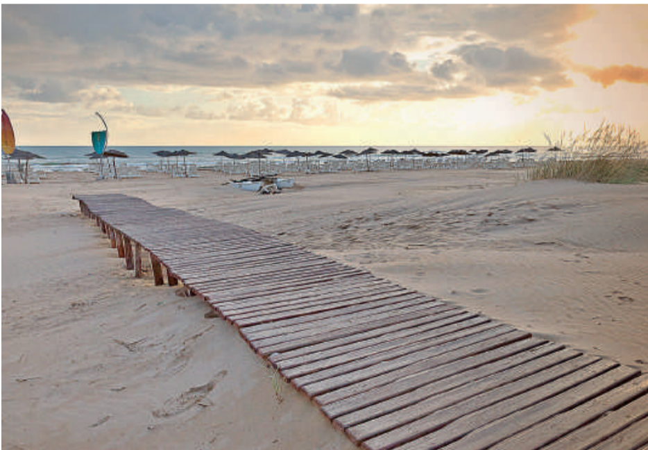
Saïdia est réputée pour la qualité de ses plages, finesse de ses sables et douceur de ses eaux

même formule est offerte à partir de 1.580 DH pour le Melia Saidia Beach et 1.486 DH pour le Be-Live hôtel. Ce dernier propose aussi une semaine à 4.095 DH. Une offre présentée également par les Melia. Six autres hôtels à Saidia ville, 2 ou 3 étoiles affichent des tarifs oscillant