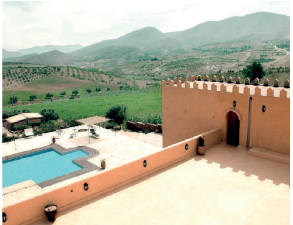
La majorité des auberges de la région sont en pisé traditionnel, toutefois de nouveaux gîtes sont aux normes internationales

le parc Lalla Aïcha, l'oasis Sidi Yahia, les anciennes bibliothèques, le théâtre Mohammed VI, les bâtisses coloniales et la place mythique de Bab Sidi Abdelwahab et ses souks avoisinants, les remparts de la médina et les hammams beldis. En matière d'hébergement, Oujda compte 41 hôtels classés allant d'une étoile à cinq. Les réservations démarrent à partir de 330 DH pour les hôtels trois étoiles et plus, comme à l'Ibis, dont l'emplacement central lui vaut tous les suffrages. À sa droite, l'Atlas Terminus un 5 étoiles à proximité de la gare ferroviaire avec des offres promotionnelles à partir de 700 DH, qui peuvent atteindre 2.100 DH en haute saison pour les suites. Un autre Atlas cette fois-ci, «Orient», en face de la célèbre porte Bab El Gharbi. Toutefois, ces deux hôtels sont encore fermés depuis l'instauration du protocole sanitaire. Par contre, d'autres hôtels classés sont ouverts: Hôtel Isly Golf, un 3 étoiles avec golf et piscine (300 DH). À quelques encablures de là, le Relax Hôtel, un 3 étoiles assure ses services à partir de 650 DH. Le prix des autres hôtels de la ville débute à 200 DH.