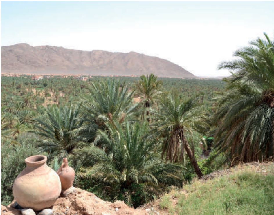
Figuig et sa palmeraie se trouvent au centre d'un itinéraire touristique saharien en mesure de relier les oasis du Drâa et le grand Sahara à la Méditerranée