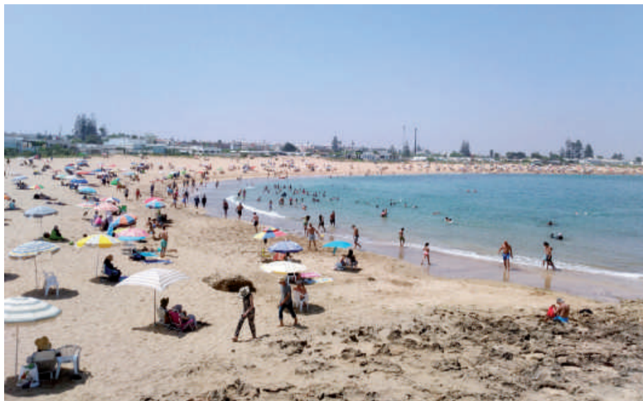
Les belles plages de la commune de Harhoura constituent une destination privilégiée des estivants nationaux et étrangers durant la période de l'été. Parmi les stations prisées, celles des Contrebandiers, Sables d'Or et Rosemarie

est-il précisé. Les familles à revenus moyens, elles peuvent trouver des logements avec des tarifs plus intéressants dans les zones avoisinantes comme Témara, Ain Atiq et même à Tamesna. Une fois installés,