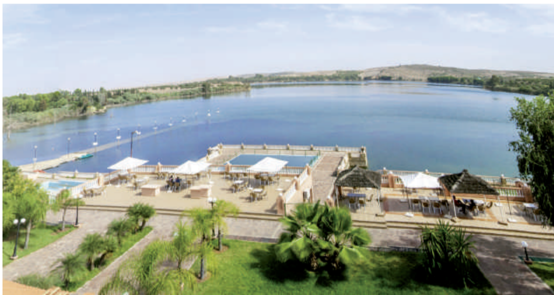
Niché en pleine nature campagnarde et jouxtant le célèbre lac Daït Erroumi, l'hôtel-Club Dar Eddaya, dans la région de Khémisset, offre une opportunité de séjour et de détente seul, en famille ou en compagnie des amis. Au début de cette saison, l'établissement a lancé une offre avec une remise de 50% sur le tarif normal

connaissent un afflux de la part des habitants de la capitale dont la plage est encore fermée à cause des travaux d'aménagement. Alors que certains parmi eux optent pour les stations situées au Nord de Rabat