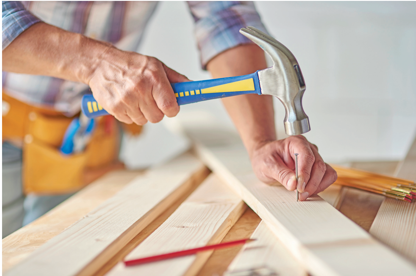
Le bricolage n'est plus considéré comme une activité réservée aux professionnels. De plus en plus de particuliers achètent dans les magasins spécialisés des produits pour effectuer des travaux manuels