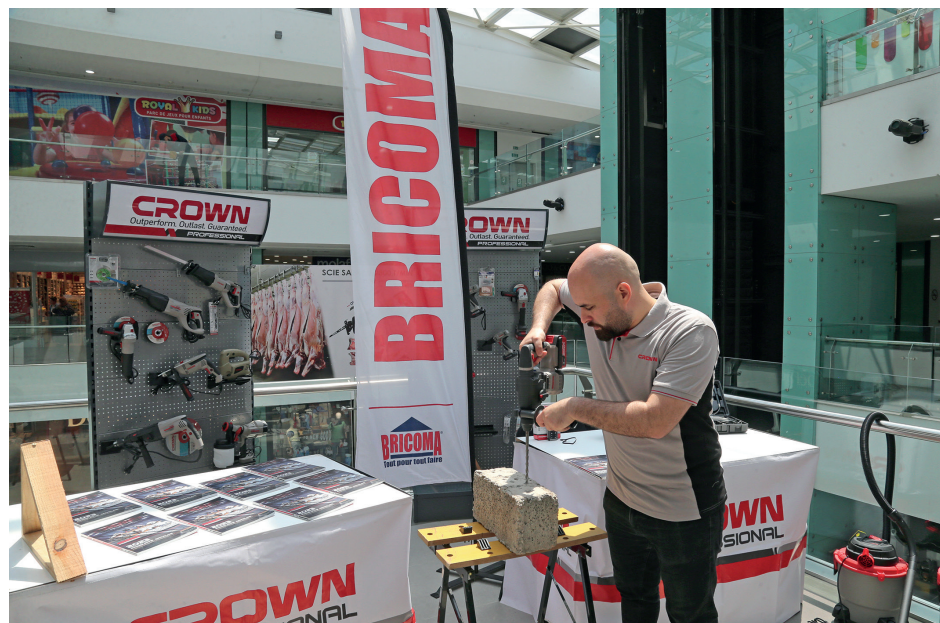
Des enseignes internationales et marocaines de bricolage se sont développées dans les principales villes du Royaume offrant des outils et matériaux de base, des équipements spécifiques, des conseils d'experts et des services après-vente pour accompagner les clients dans leurs projets

tion et Animation Réseau à Bricoma. La vente de meubles en kit à monter soi-même et le confinement ont également fait sauter les barrières psychologiques, révélant un potentiel énorme à exploiter. En effet, les Marocains sont de plus en plus nombreux à entreprendre des travaux de rénovation et de décoration dans leur logement pour l'adapter à leurs goûts et besoins. Menuiserie, plomberie, électricité, peinture, etc. les Marocains qui n'étaient pas forcément bricoleurs n'hésitent plus à mettre la main à la pâte. «Le bricolage n'est plus considéré comme une activité réservée aux profes-