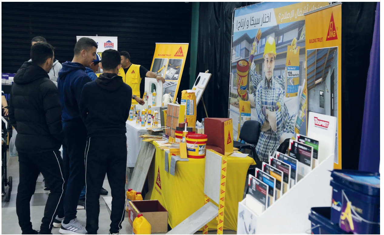
Ces ateliers ciblent aussi les gens qui veulent s'initier au bricolage rien que pour pouvoir comprendre le langage des artisans auxquels ils font appel pour leurs travaux

SAVIEZ-vous que le 24 mai célèbre la journée mondiale du bricolage? Lancé en 2013 par le site internet ManoMano, cet événement est l'occasion de célébrer la passion du bricolage, de promouvoir la créativité et de partager des compétences pratiques. Au Maroc, où les enseignes fleurissent rapidement, on célèbre aussi cette journée. Ainsi, Bricoma organise du 19 au 28 mai, des ateliers d'apprentissage gratuit à l'attention des novices curieux, des enfants, des femmes ou des bricoleurs aguerris. Le programme (jours, horaires et lieux) est disponible sur le site du magasin. L'objectif de cette journée est de rappeler «qu'on a tous un bricoleur caché en nous», que nous sommes tous capables de réparer, transformer et créer. «Cette opération vise à promouvoir le bricolage par soi-même surtout quand il s'agit de petites réparations. La participation à ces ateliers permet de bénéficier gratuitement d'un apprentissage enrichissant. Le Marocain devient de plus en plus bricoleur et Bricoma veut accompagner ce changement», explique Youssef Benjelloun, directeur communication et animation réseau à Bricoma. En plus de cette action ponctuelle, l'enseigne ma-